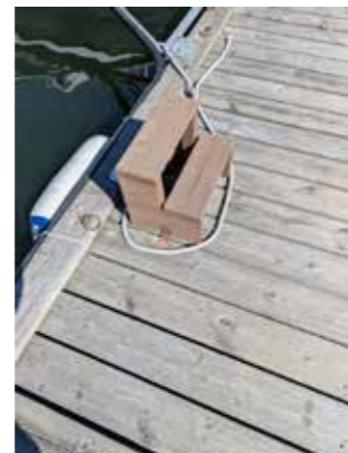
Kan vara målrad.