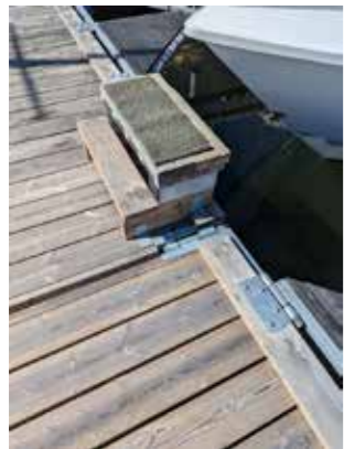
Vettigt att utnyttja hela bryggan – få gör det.