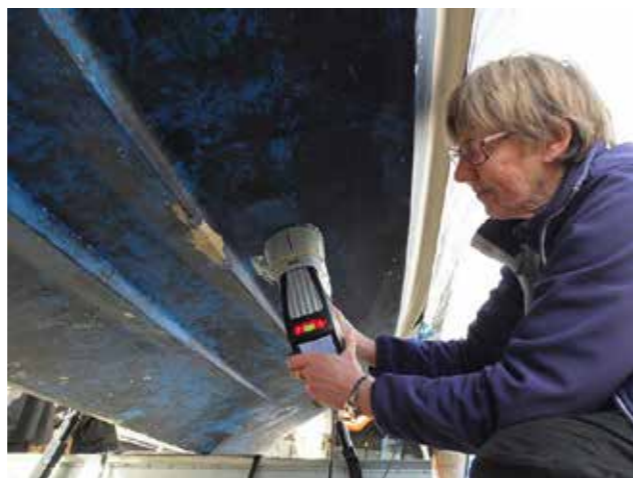
Mätning med XRF.

De medlemmar som har båt på varvet och som är äldre än 1996 och som ännu inte kunnat uppvisa ett godkänt mätprotokoll ska nu anmäla sin båt till provtagning.