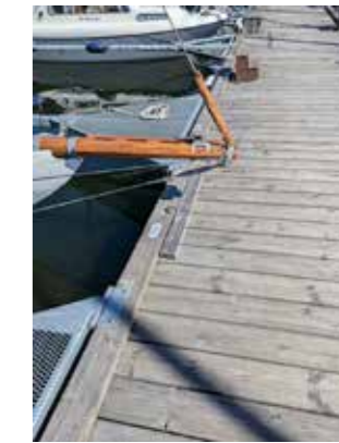
Har man ingen pall kan man väl vara lite i vägen ändå (det är för att båten och bommen inte ska sticka ut för mycket åt andra hållet).