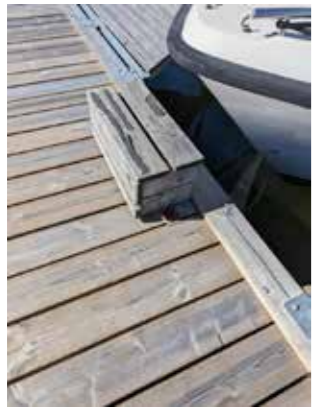
Föredömligt "smala", enkla och ser stabila ut (utan överkonstruktion).