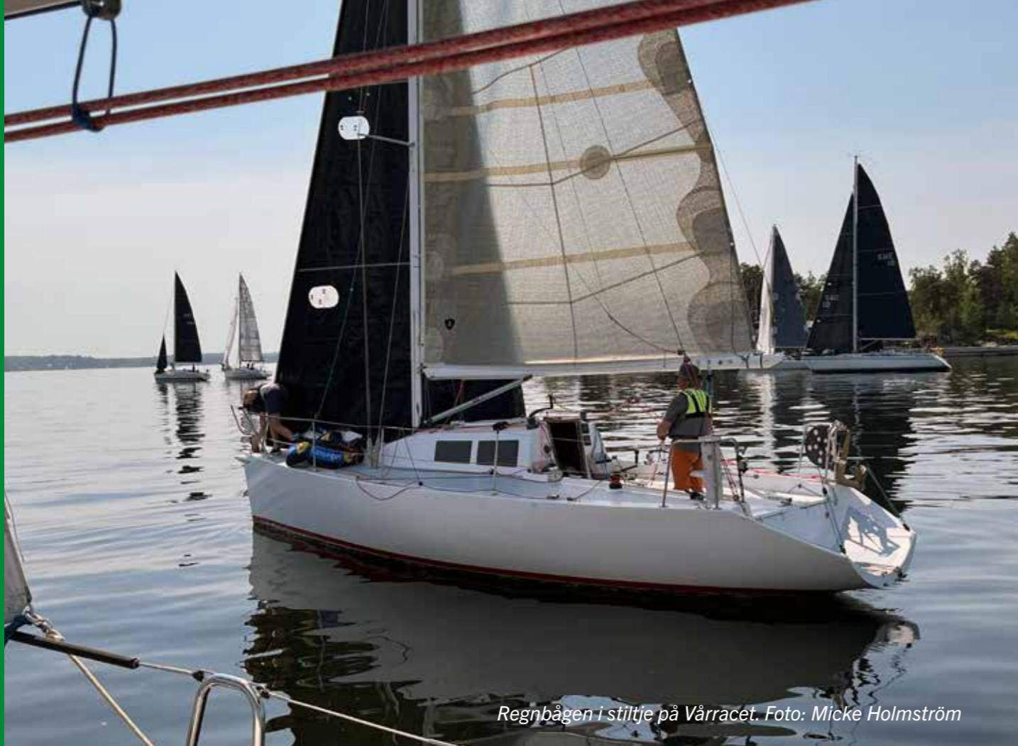
Regnbågen i stiltje på Vårracet.