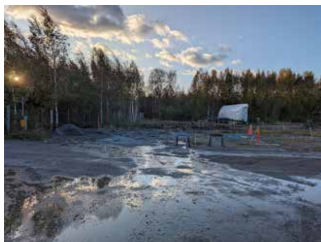
Projektet i sin inledande fas. Vad det måne bli av detta.

På mindre än ca 5 månader har vi nu blivit i princip klara med bygget av 2 st spolplattor. Arbetet har i huvudsak drivits av ett antal medlemmar med ett stort kunnande inom olika områden vilket har varit en förutsättning för att få projektet i hamn.