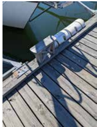
Väldigt diskret och enkel och klart ur vägen.