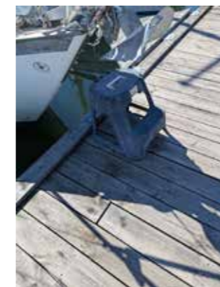
Varför krångla till det.