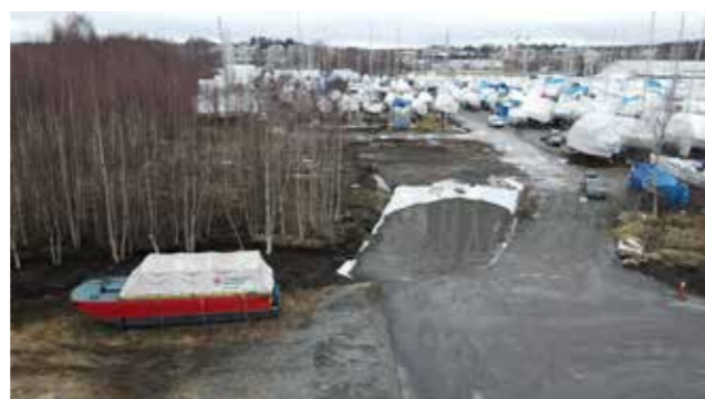
Markduk och ytskiktet.