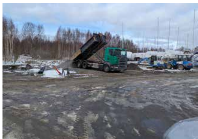
Grus börjar anlända.

Vi började med att anlägga en ny infart från slipfickan till varvsområdet. Det innebar en ny vägtrumma, nygrundande vid staketet osv. Marken var här helt bottenlös, vilket gjorde oss lite tveksamma om bärigheten. Skulle det vara tillräcklig för att bära både sublift och båt med den totala tyngd (ca 25 ton) som skulle bli aktuell. Men med en kraftig markduk och ett tjockt bärlager visade det sig att infarten inte skulle vara några problem. Via infarten har vi nu kört in ett bärlager på ca 850 ton till hela vår anläggning som är ca 300kvm stor. Det innebar att vi har fått ca 60 lastbillass där lastbil och grus vägde runt 27 ton. Alltihop har i olika skikt packats med markvibrator.