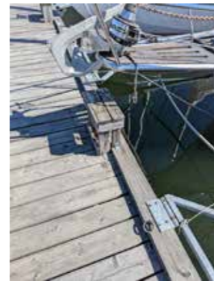
Väldigt diskret men kan den nyttjas?