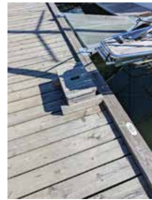
Diskret och men nann – men varför stödplank som sticker ut?