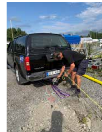
Hjälp av bilen vid kabeldragning.