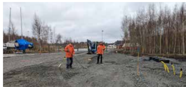
Mycket jobb med att "kratta" det jämnt.

Nästa steg var nu att asfaltera spolplattorna och ytorna där filterhuset och pumphus ska placeras totalt c:a 300 kvm. Även pumphuset har ritats och byggts av medlemmar.