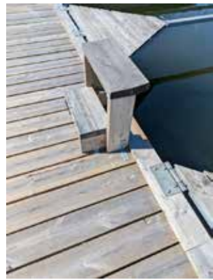
Smal men kanske något ostadig?