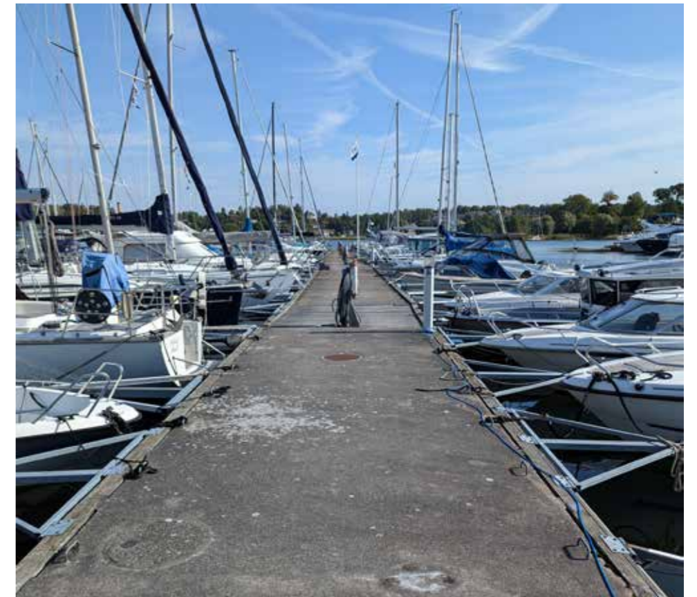
Några bryggsektioner har inga eller ytterst få pallar (kanske blir det en trend. Bygger han kan väl jag...