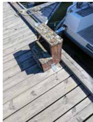
Några är gamla och ärrade.