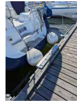
Kan man ge sig på en trendspaning och anta att alla pallar saknar funktion om 20 (?) år då alla backar in med sina öppna häckar?