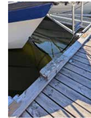
Väldigt diskret – men gör det någon nytta?