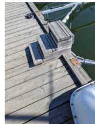
Första trappsteget känns ju ganska onödigt.