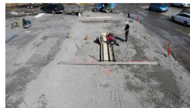
Här börjar det roliga jobbet.

Nu har vi kopplat in ström och vatten till anläggningen och är klara för att provköra och få det hela godkänt av respektive myndighet.