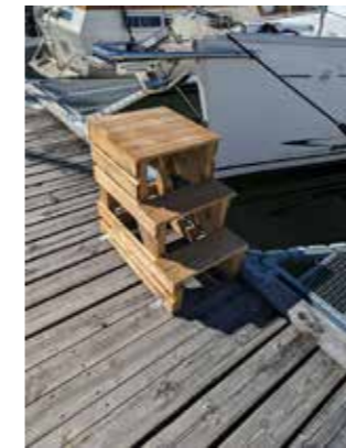
Vilka konstruktioner! – bra med vinklade trappsteg.